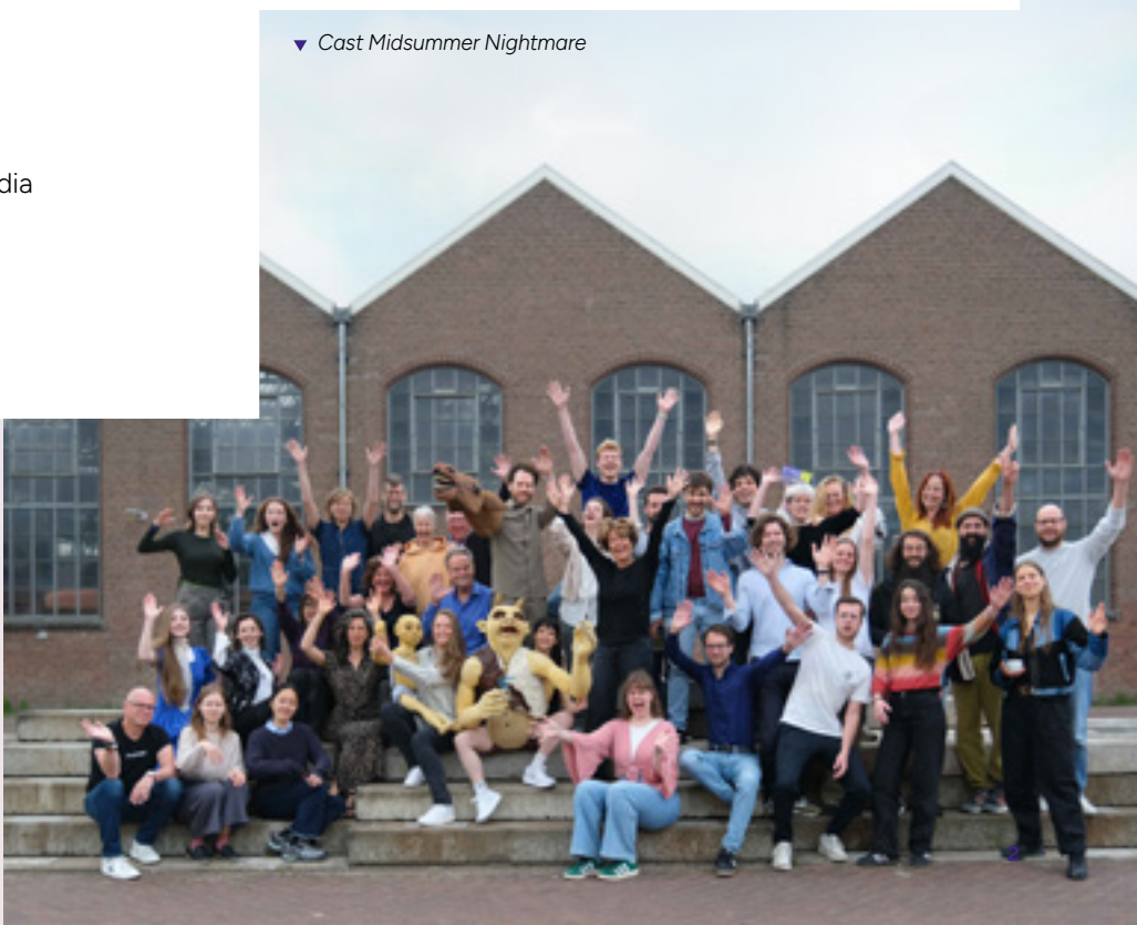
▼ Cast Midsummer Nightmare